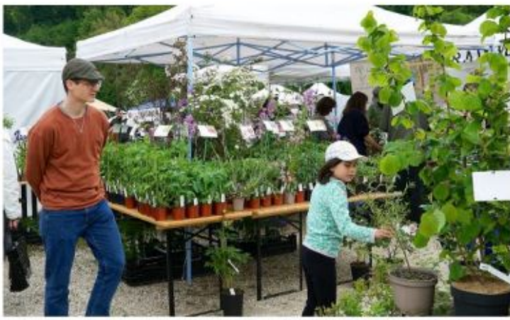
Les producteurs étaient là pour donner conseils et explications et au milieu des plantons 100% bio, ça fleurait bon le printemps.