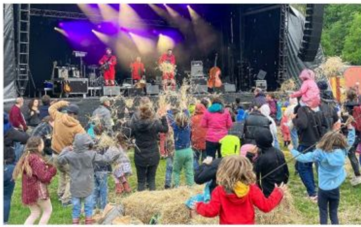
Encouragé par le groupe Les Petits Chanteurs à la gueule de bois, les enfants se sont lancés dans une bataille de paille.