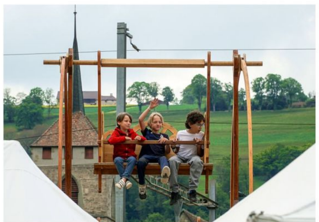
Les enfants survolent le monde dans la grande roue en bois et rivalisent de grandeur avec l'église Saint-Etienne.