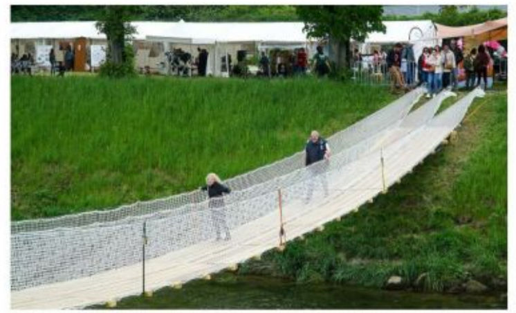
Traverser les passerelles reliant les deux rives de la Broye, une expérience aussi utile que ludique.